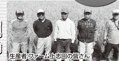
生産者ファーム上志田の皆さん